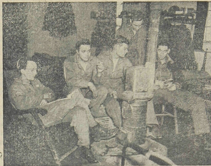
A tripulação de uma «Fortaleza Voadora» norte-americana, que acaba de regressar á sua base na Inglaterra. Depois de bombardear as posições nazistas da Europa, espera, em seu posto, o momento de voltar a bordo de seu aparelho para cumprir a ordem de partir de novo contra o objetivo inimigo.