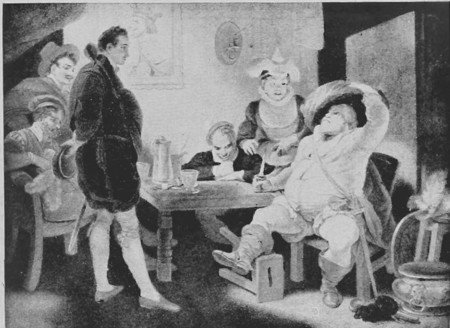
Falstaff e o seu bando de foliões (1 Henrique IV, II, iv ). Reprodução de um quadro de Roberto Smirke.